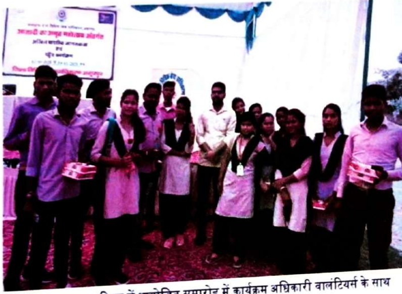
जिला न्यायालय परिसर में आयोजित समारोह में कार्यक्रम अधिकारी वालंटियर्स के साथ